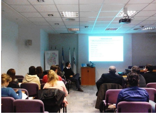
Capacitación a encuestadores