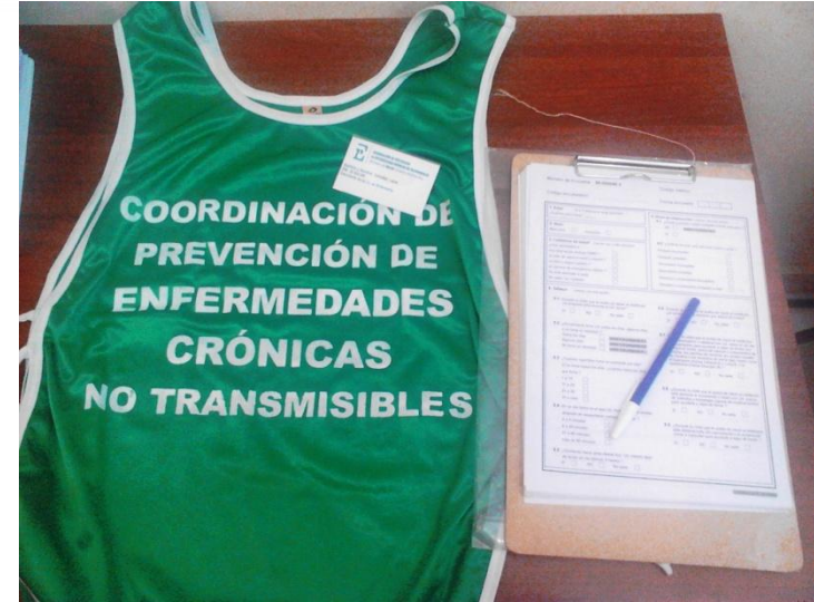
Logística aportada por el Ministerio

Capacitación a los médicos de los clusters activos