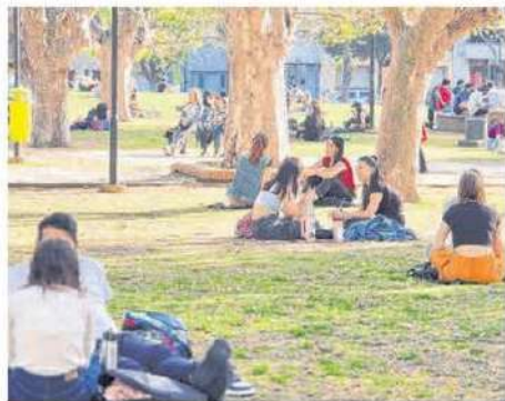
EN LA PLATA, LA ALTA DENSIDAD DE ÁRBOLES AGRAVA LA SITUACIÓN/ DEVIAN ALDAY

“Suele haber estornudos frecuentes, congestión o secreción nasal, picazón y enrojecimiento ocular y di-