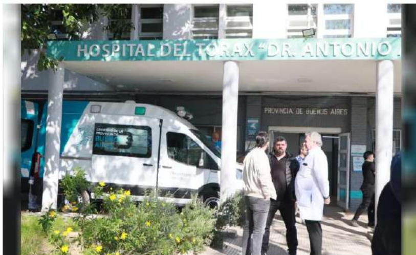
El hospital Cetrángolo armó una lista de espera con solicitudes de turnos para resolver en dos o tres meses, según el personal de la entrada.